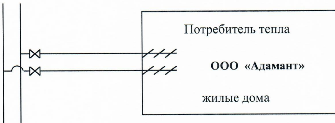
Схема теплоснабжения «Исполнителя»: